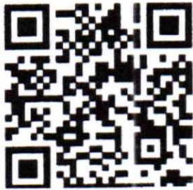
สิ่งที่ส่งมาด้วย ๓

คู่มือการปฏิบัติงานระบบจัดซื้อจัดจ้าง (Purchasing Order: PO)